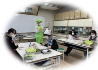
公民館の料理教室